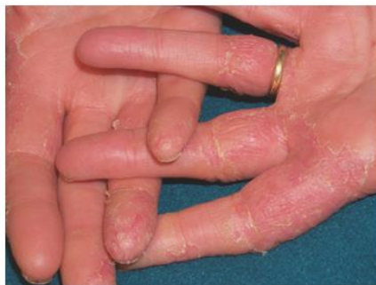
Dermatite da p-fenilendiamina (parrucchiera)